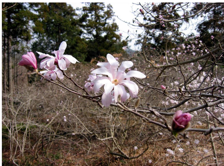
伊川津町柁のシデコブシ群落 国指定天然記念物