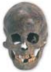
叉状研歯のある頭骨