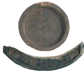
東大寺軒丸瓦(上) 軒平瓦(下)