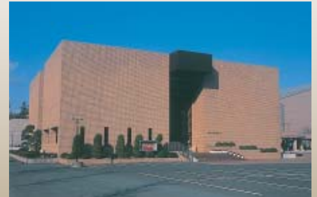
田原市渥美郷土資料館